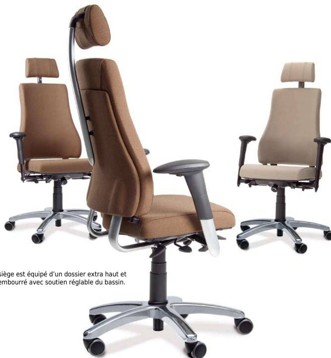
Le siège est équipé d'un dossier extra haut et rembourré avec soutien réglable du bassin.

Axia Max 24/7 le siège pour poste informatique destiné à une utilisation 24h/24.